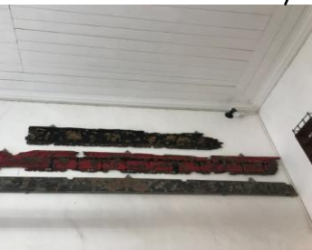
n - 掛牆裝飾組件 n - Elementos decorativos de parede