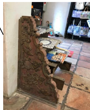
f - 舊雕花托木 f - Peça antiga de madeira entalhada