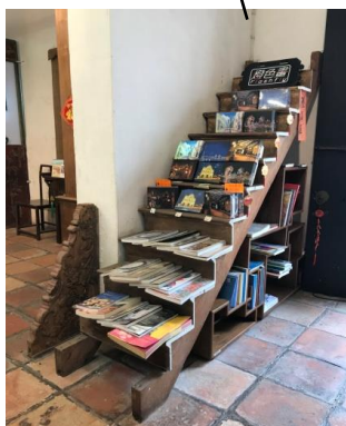
d - 舊木樓梯書架 d - Escada de madeira antiga utilizada como estante