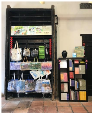
e - 舊趟櫳木門 e - Antiga porta intermédia de correr com barras de madeira horizontais